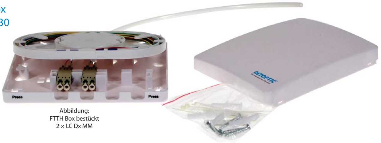
Abbildung: FTTH Box bestückt 2 x LC Dx MM